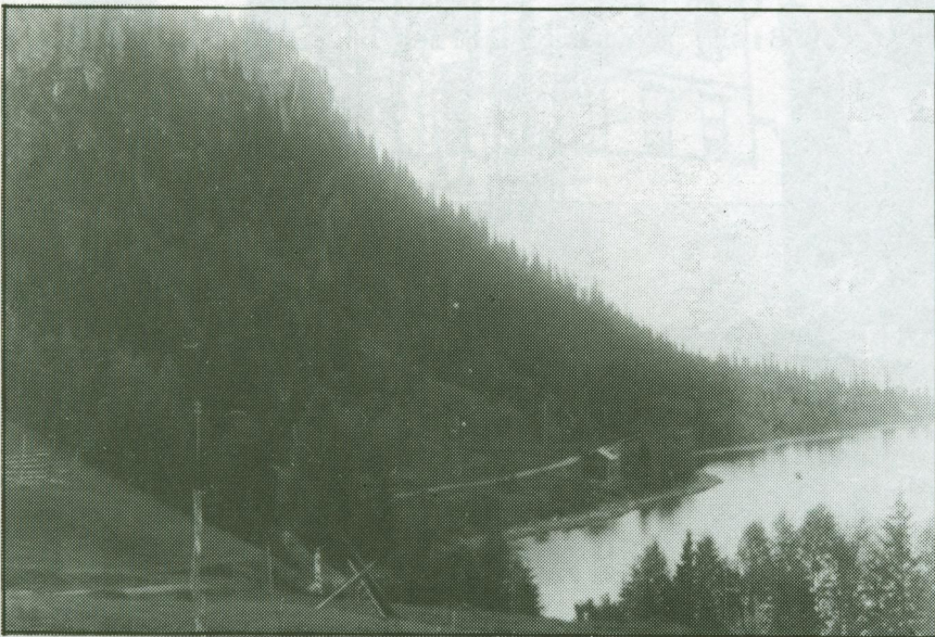
Kalkbergsviken. Svedbergstorpet och längst bort Oskar Morins torp.